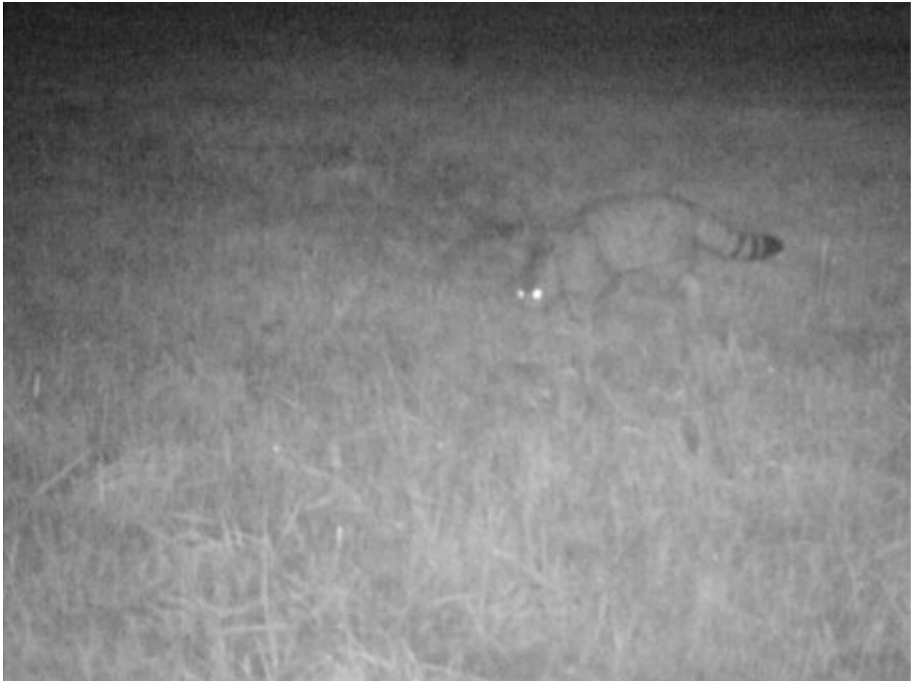
Wilde kat in Zuid-Limburg, oktober 2013

Cameraval De waarneming van de wilde kat werd pas afgelopen week gemeld bij ARK Natuurontwikkeling. In oktober 2013 werd de kat met een zogenaamde cameraval vastgelegd. Deze camera's werken met een bewegingssensor; bij beweging maken ze een foto of filmpje. Doordat de camera's zijn uitgerust met infrarood licht kunnen ze ook 's nachts, als de kat actief is, beelden maken.